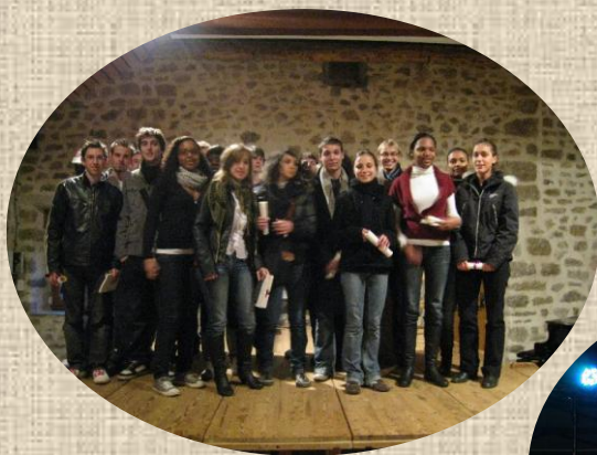
Remise des diplômes 2009