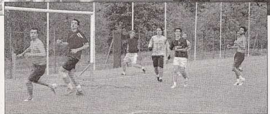
Hors programme, les anciens et actuels élèves du Centre de tennis se sont improvisé une partie de football. Même la pluie n'a pas pu les arrêter : les « anciens » n'ont rien perdu de leur pugnacité. Menés par leurs cadets, ils ne lâchaient pas l'affaire